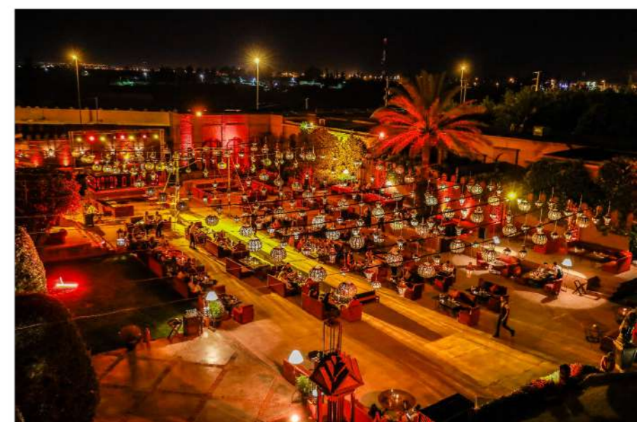
RESTAURANT - PATIO/LOUNGE - ESPLANADE